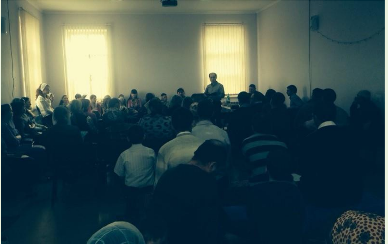
슈메를라 지역교회 주일 집회 2015.4.26