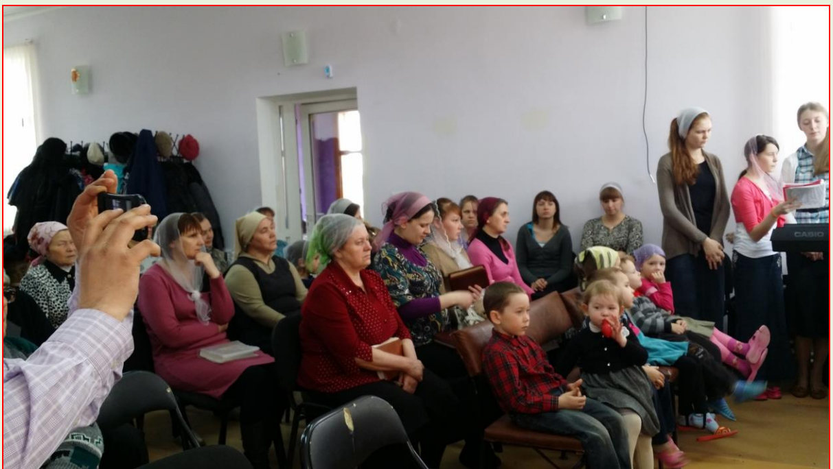
슈메를라 지역교회 주일 집회 2015.4.26

이곳 슈메를라에서의 사역은 매우 안정적이다. 그러나 또 새로운 개척지를 향하여 나아간다. 젊은이들을 보살피고 키우고 양육해야 할 사명을 주셨기에 이곳은 다른 사역자에게 맡기고 새로운 사역지를 향하여 나갈 준비를 하고 있다. 부르심의 사명의 길이 다 다른 것이다.