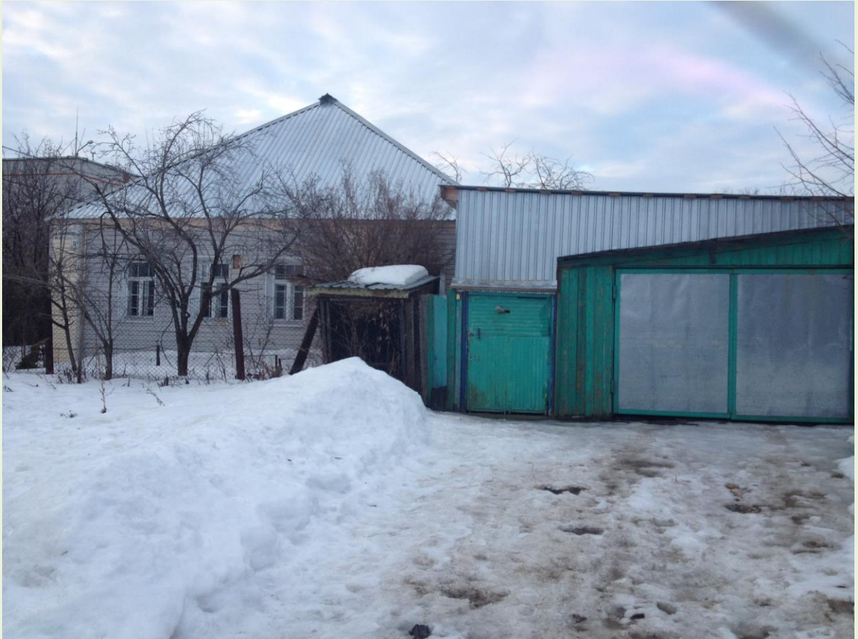
180 평의 땅과 낡은 건물, 온통 수리하여야만 살 수 있는 형편이다.