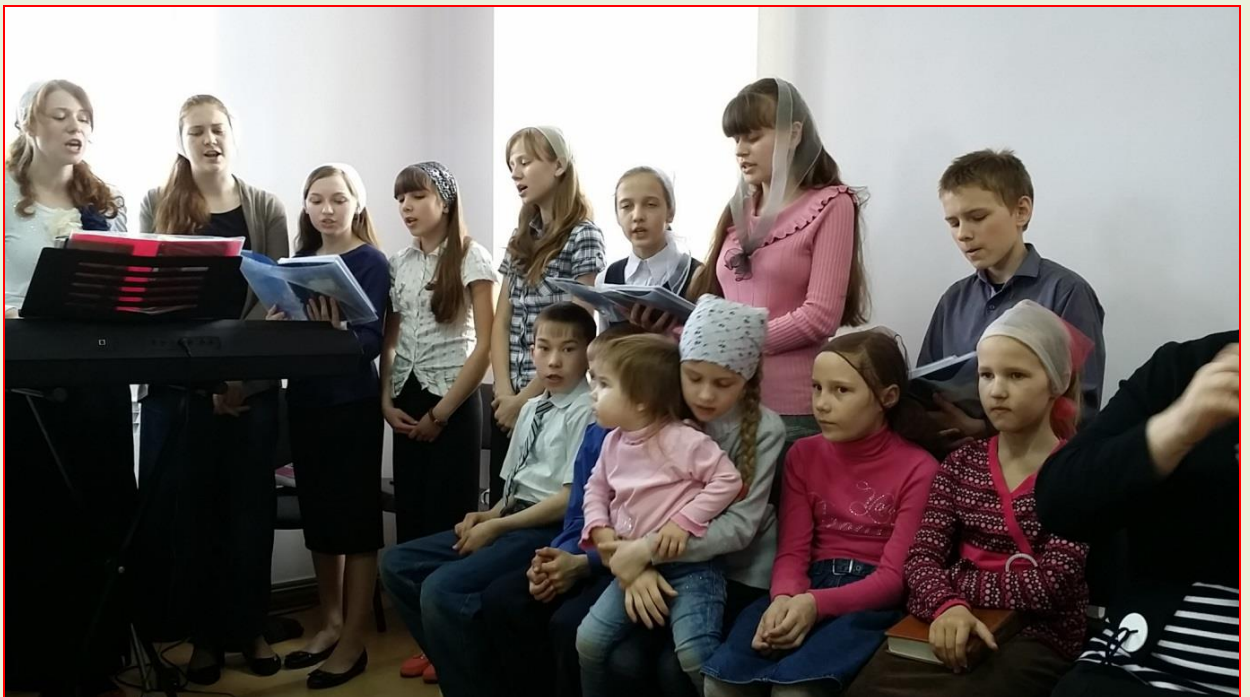
슈메를라 지역교회 주일 집회 2015.4.26

삶의 안락함이나, 편리함은 찾아 볼 수 없다. 모든 것이 불안정하고, 부족하고, 아쉽고, 일이 끝이 없다. 그러나 이곳에서 사역이 이루어진 다는 소망을 가지고 나간다.